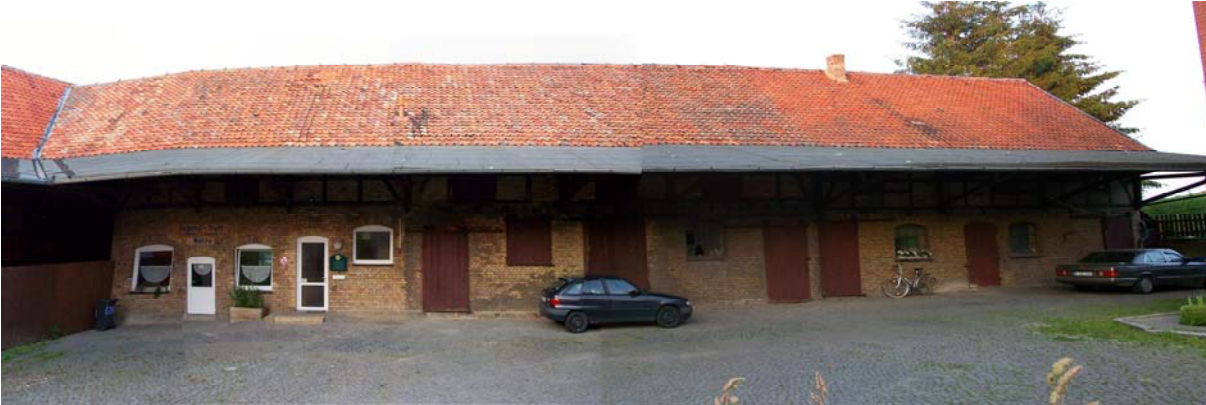
Panoramabild aus drei Fotos