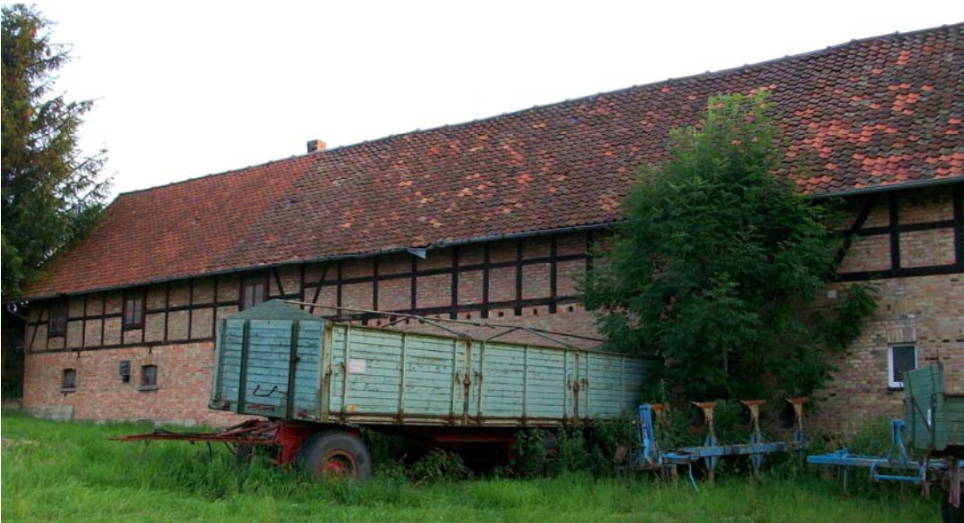
Blick von Nordosten